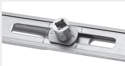
Schließzapfen E anpressdruckverstellbarer Zapfen

Alle drei Schließzapfen sind einfach zu verstellen – für ein perfekt geschlossenes und dichtes Fenster. Die beiden Sicherheits-Pilzzapfen sorgen in Verbindung mit Sicherheitsschließstücken für eine besonders hohe Sicherheit.