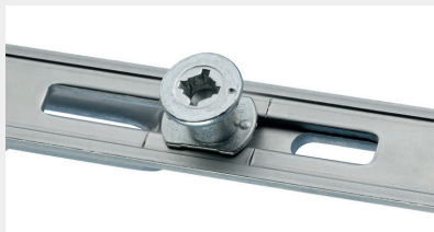
Schließzapfen P anpressdruckverstellbarer Sicherheits-Pilzzapfen