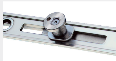
Schließzapfen V (bis RC 3 / RC 3 N) höhen- und anpressdruckverstellbarer Sicherheits-Pilzzapfen