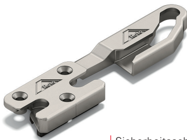
Sicherheitsschließstück für Kipp-Lüftung