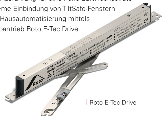
Roto E-Tec Drive